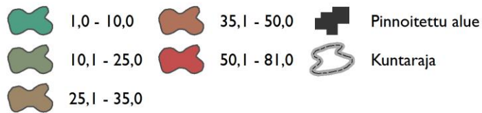
Kuva 17. Pinnoitetun alueen osuus maa-alasta pienväluma-alueittain nykytilanteessa.

Pinnoitetun alueen osuus pienväluma-alueittain, %