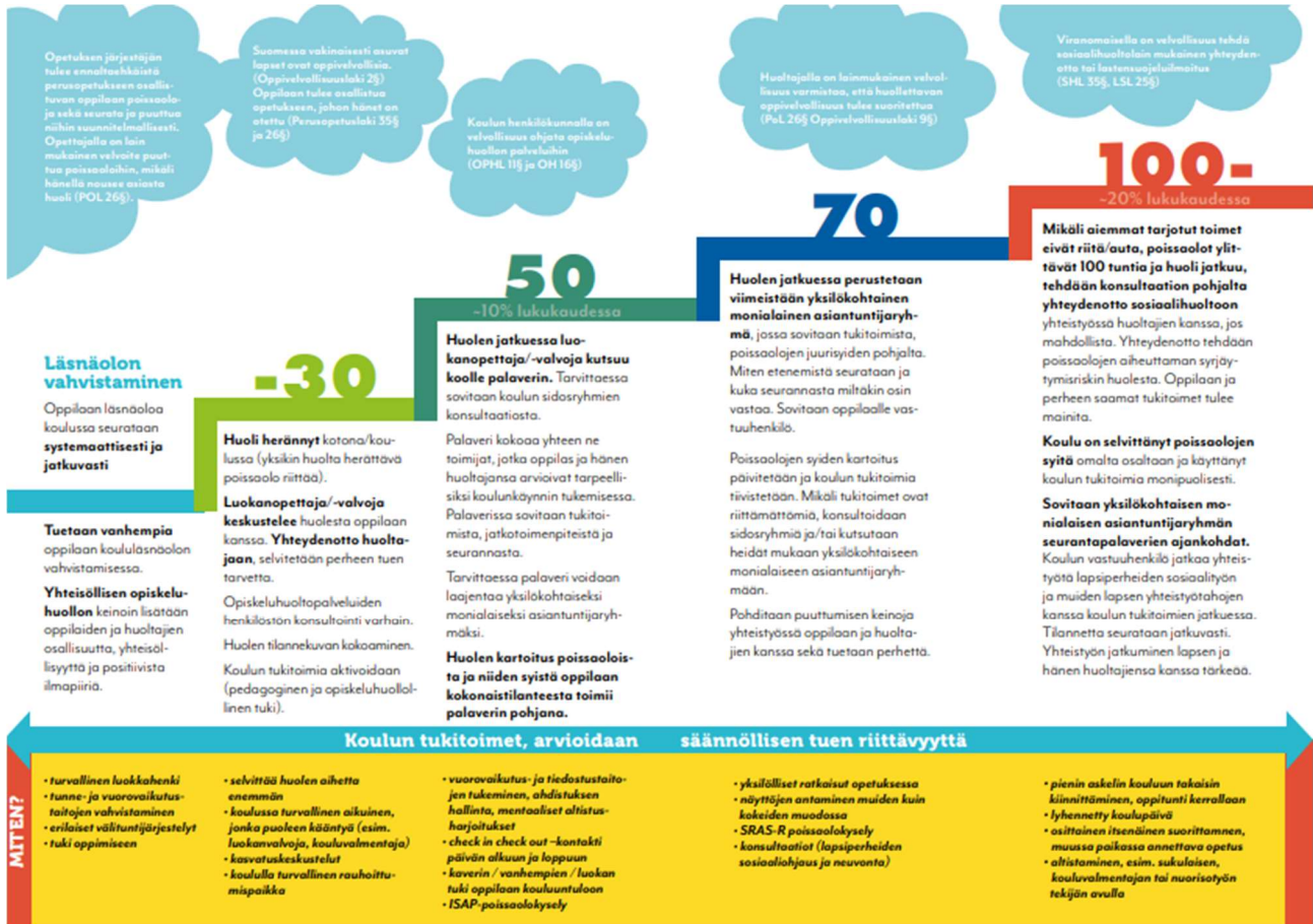
Kuva: Toimintamalli oppilaan poissaolotilanteissa

Kouluissa oppilaiden läsnäoloa pyritään vahvistamaan yhteisöllinen opiskeluhoillon keinoin. Koulun kiinnittymistä pyritään tukemaan mm. tunne- ja vuorovaikutustaitojen tukemisella. Koulun kiinnittymisen apuna on suunnitelmallinen poissaolotietojen seuranta. Yhteisöllinen opiskeluhoiltoryhmä seuraa poissaoloja luokkatasoisesti. Yhteisöllinen opiskeluhoiltoryhmä käy läpi koulun poissaolotilat luokkatasoisesti syysloman ja talviloman jälkeen. Seurannan tarkoituksena on hyödyntää tietoa yhteisöllisen opiskeluhoillon toimintojen suunnittelussa ja kohdentamisessa poissaolojen ennaltaehkäisemiseksi ja niihin puuttumiseksi.